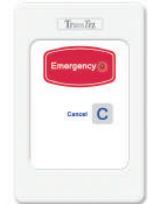
DK-NCP5-EC 緊急呼叫面板 防水等級IP68