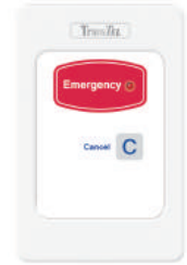
DK-NCD5-BE 緊急呼叫面板 防水等級IP68