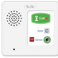
DK-NCD-5 護理師呼叫面板 外加SOS功能