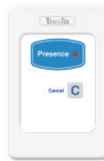
DK-NCP-NP 醫護人員巡房面板 可當取消面板