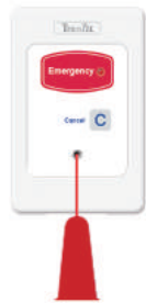
DK-NCP5-BE 浴廁緊急呼叫 防水等級IP68